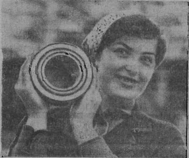
Украинская ССР. Готовится к пуску первая очередь Луцкого государственного подшипникового завода № 28. Ее мощность — три миллиона подшипников в год. В порядке эксперимента на предприятии выпущена пробная партия тяжелых конических подшипников. Их сейчас испытывают.