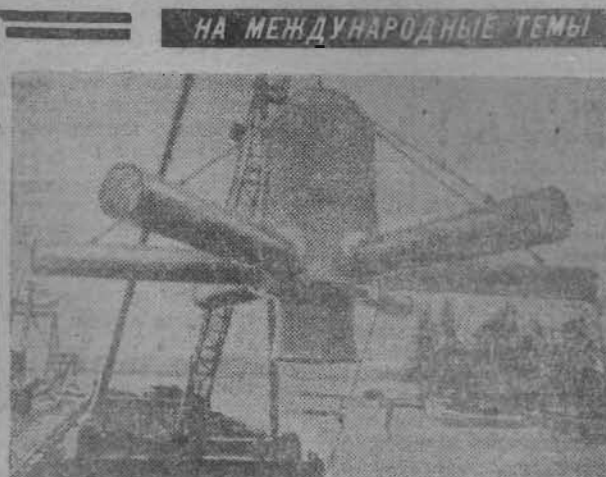
Находящееся на территории Западного Берлина озеро Тегелер-зее постигла биологическая смерть: промышленные отходы уничтожили в нем все живое. Теперь с помощью вот таких огромных воздухоочистительных агрегатов, которые будут непрерывно обогащать воды Тегелер-зее кислородом, городские власти надеются к 2000-му году вернуть озеро к жизни.

С. ВИНОГРАДОВА, главный врач станции переливания крови.