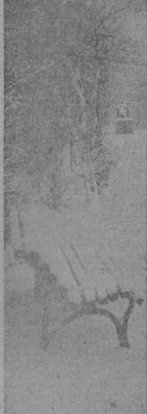
На фотопаннуре «Ленинского шахтера».

ИНГА. «ЗА РАБОТОЙ». ПЕРВЫЙ СНЕГ.