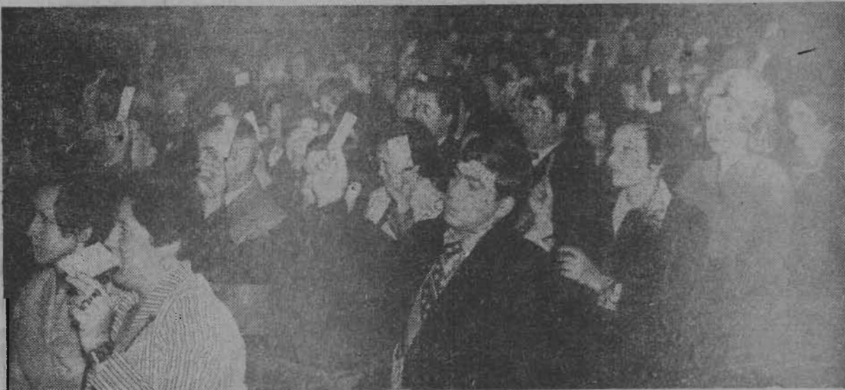
На снимке: голосуют делегаты конференции.