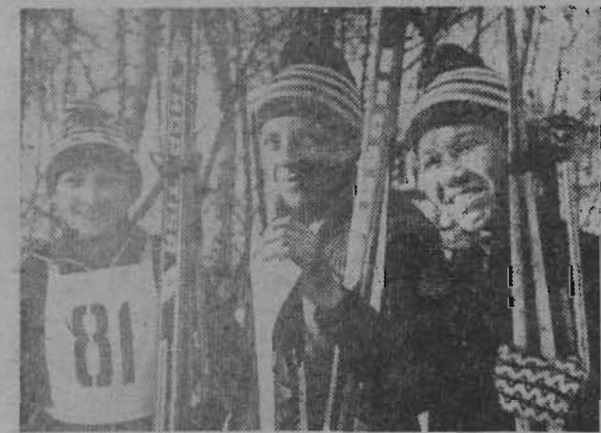
Текст и фото П. Гребнева.