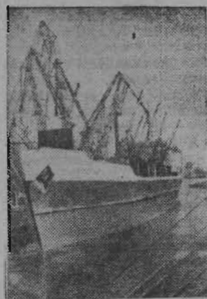
Одесса. Специализированный комплекс по обработке судов с грузами для Социалистической Республики Вьетнам создан в Одесском ордена Ленина морском порту. Новый участок, оснащенный самой современной техникой, обслуживают четыре

укрупненные комплексные бригады декегов — механизаторов. Новая прогрессивная технология портового комплекса позволила резко увеличить грузооборот на вьетнамской линии, повысить качество переработки грузов, сократить стояночное время судов под черпаком.