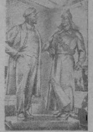
боевая шапка В. И. Чапаева, автомат Александра Матросова, бесценные документы: письма с фронта, партийные и комсомольские билеты, обгоревшие кровью сынов Отчизны, стоявших насмерть. Они показывают, как, не жалея сил и самой жизни, защищали любимую Родину советские воины, стоявшие под руководством ленинской партии за свободу и независимость Страны Советов.

«Ленин был величайшим полководцем в истории войн трудящихся масс за свое освобождение от угнетателей, он положил начало советской регулярной армии, основанной на принципах современной науки и техники». Эти слова М. И. Калинин предпосланы экспозиции Центрального музея Вооруженных Сил СССР, которому исполнилось 60 лет.