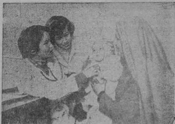
КАБУЛ. Уже много лет работает в афганской столице Центр матери и ребенка, построенный при содействии Советского Союза. В этом медицинском учреждении ведут прием опытные специалисты. К услугам посетителей Центра — детский сад, педиатрическая, стоматологическая, рентгеновский и другие кабинеты.