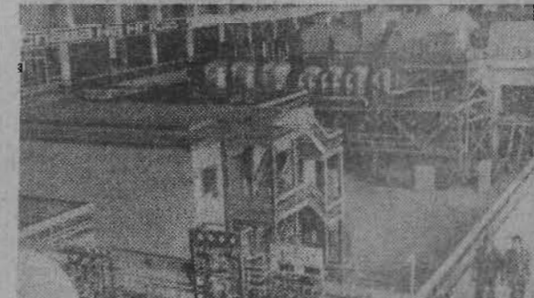
ЦРБ. Машинный зал теплоэлектростанции «Маршала Восток-3», сооружаемый при техническом участии Советского Союза.

Эта ТЭС принципиально отличается от двух других станций, работающих на буром угле из Марицкой бассейна. Ее агрегаты действуют по принципу полного сгорания угля, разработанному советскими специалистами.