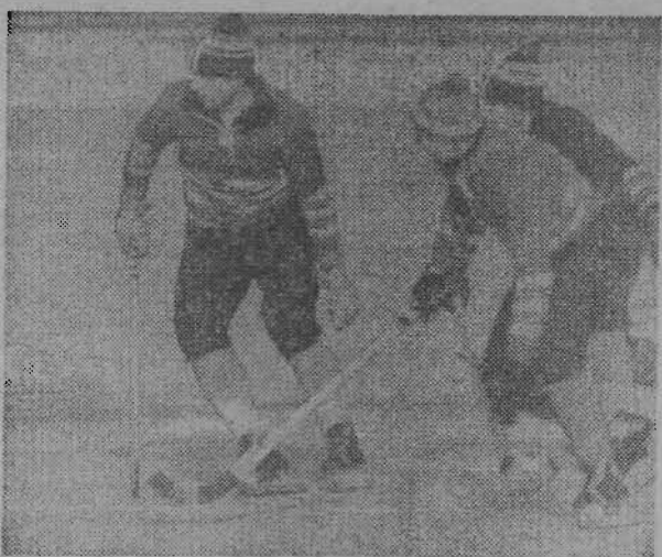
На снимке: момент матча между «Мотором» и командой шахты «Кузнецкая».

В число призеров может войти и команда СГПУ № 88, которая проводит на этой неделе две игры с «Мотором» и «Кировцем».