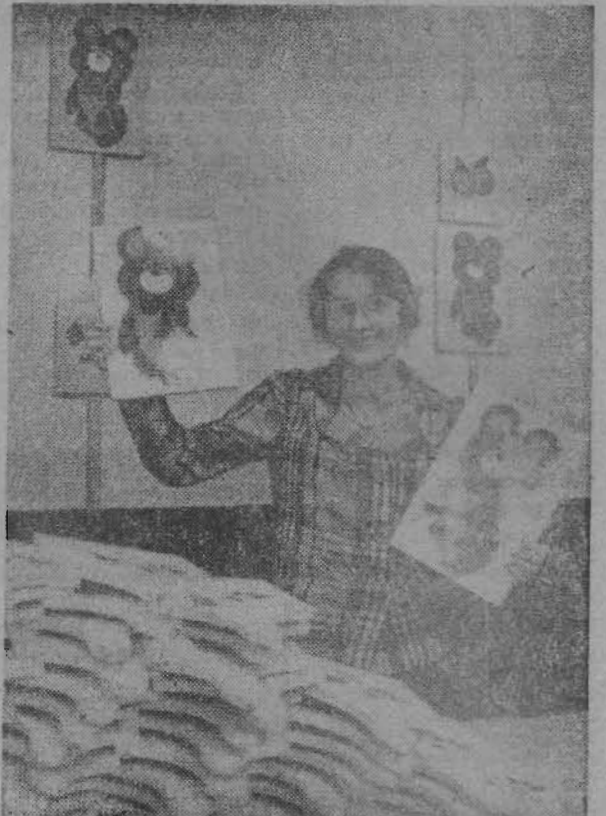
На Киселевской мебельной фабрике, на участке сувениров, освоен новый вид продукции — настенное панно с изображением олимпийского мишки. Продукция пользуется у покупателей большим спросом. На снимке: на участке сувениров Киселевской мебельной фабрики.