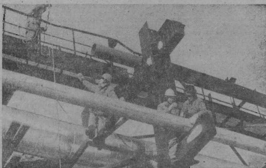
НОВОКУЗНЕЦК. В ближайшее время на Западно-Сибирском металлургическом заводе вступит в строй и даст первую продукцию сталепрокатный стан. А пока здесь идут еще работы — заканчивается монтаж главной магистрали трубопровода пара и сжатого воздуха.