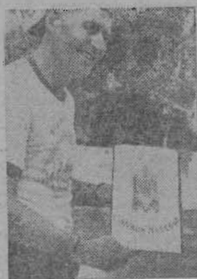
ШРИ ЛАНКА. На улицах Коломбо в течение нескольких дней ливар можно было видеть необычного велосипедиста: на руле его машины огромный глобус, на багажнике — дорожные ящики и красный флаг с надписью на русском и английском языках «Москва, Олимпиада-80».