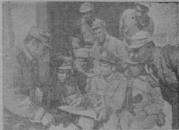
ДРА. Зорко стоит на страже завоеваний апрельской революции войны Народных вооруженных сил Афганистана. Растет воинское мастерство и политическая подготовка афганских солдат и офицеров.