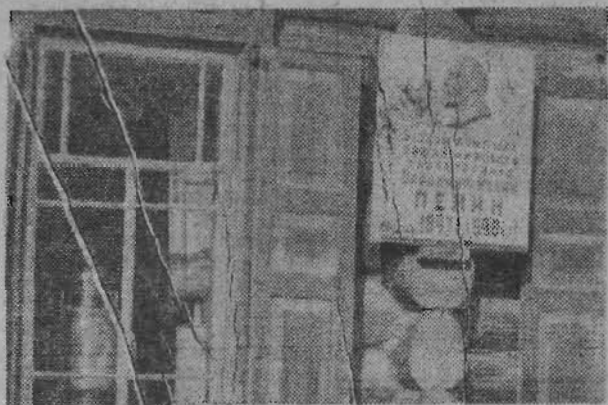
Советский народ свято сохраняет все, что связано с именем и деятельностью В. И. Ленина — вдохновителя и организатора социалистической революции, основателя Коммунистической партии и Советского государства, гениального мыслителя и революционера.

МЕМОРИАЛЬНЫЙ МУЗЕЙ-ЗАПОВЕДНИК «СИБИРСКАЯ ССЫЛКА В. И. ЛЕНИНА»