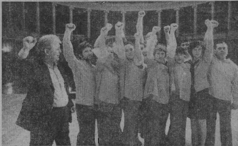
сем недавно совмещал эту работу с основной — на заводе, а сейчас целиком отдал себя художественной самодельности. Он сумел сплотить стабильный коллектив, вооружил его

Агитбригада Дворца культуры алюминщиков с полным значением именем «Кузнечные задирь» широко известна не только на своем предприятии — алюминиевом заводе и не только в Новокузнецке. Слава этого народного коллектива давно шагнула за пределы Кузбасса. Он принимал участие в зональных смотрах, несколько раз с творческим отчетом выступал перед строителями БАМа.