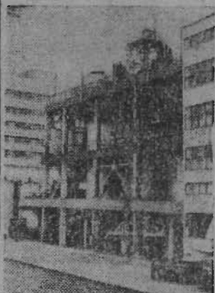
ПРБ. Новый завод по производству хлора, хлорида, поливинилхлорида и Ленинском промышленном комплексе. Этот важный объект большой химии Болгарии построен при содействии Советского Союза.

ГДР. За минувшие тридцать лет на верфи «Фольксверфт» в городе Штральзунде построено свыше тысячи судов различных типов для Советского Союза.