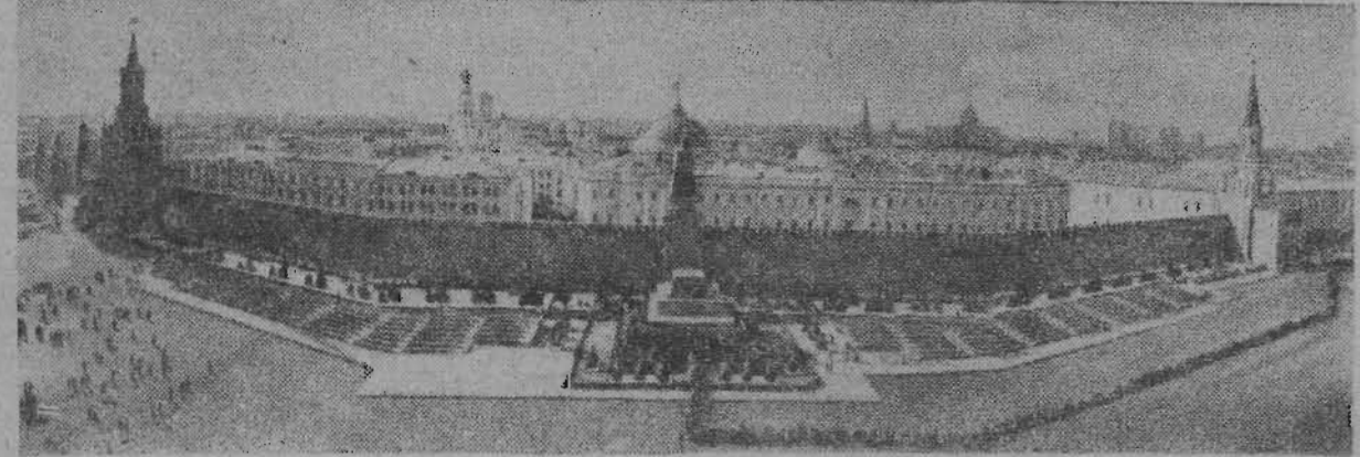
Москва. Красная площадь. К Ленину.

на внимательно. В этой стране вот уже больше шестидесяти лет все при- надлежит простым людям. Таким как мы с тобой. Все: земля, заводы, фаб- рики, дома, дворы, в которых раньше богачи жили. Понимаешь? Все дети учатся в школе, по- тому что за учение не нужно платить. Больные лечатся в больницах тоже бесплатно. — Дядя Луис, — не- доверчиво проговорил Мартин, — это все похо- же на сказку. Ты меня утешаешь? — Не сказки я тебе, Мартин, рассказываю, — строго сказал дядя Луис. — Шестидесять лет назад Россия была такой же нищей и угнетенной стра- ной, как и наша. Но жил в этой стране человек по имени Ленин. Он хотел счастья для всех-всех лю- дей своей страны, и не только своей. Он думал обо всех угнетенных во всем мире... — И о нас с тобой? — Да, Мартин, и о нас с тобой. Такой он был человек. Но он не толь- ко хотел. Просто хотеть — этого мало. Он знал, как это сделать. Он знал, что в стране скла- дывается революционная ситуация. Запомни это слово, парень. А означа- ет оно вот что: низы бо- льше не хотят жить по- старому, а верхи больше не могут управлять по- старому. Понял? — Не очень... — Ну, низы — это мы с тобой, значит. Ты вот хочешь и дальше жить так, как сейчас? — Не хочу! — Я тоже не хочу. И никто не хочет. Все, мы низы, не хотим. Вот так вот, Мартин, лучше ме-