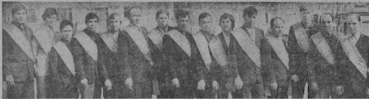
Хорошая традиция существует на шахте имени Кирова: по итогам прошедшего года назначают членов символической бригады, в состав которой входят лучшие горняки шахты. Недавно на шахте были на-