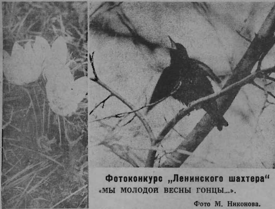
Фотоконкурс „Ленинского шахтера“ „МЫ МОЛОДОЙ ВЕСНЫ ГОНЦЫ...“