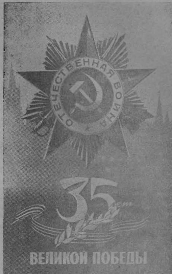
Плакат художника В. Викторова. Издательство «Плакат».

— Меня удивляет гордость за ваших земляков,