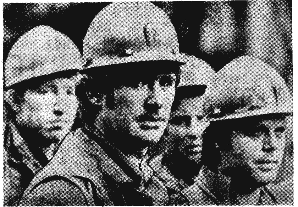
Реконструкции шахт — ударные темпы!

Редакции областных, городских и многотиражных газет, областной комитет по телевидению и радиовещанию должны широко освещать ход и итоги социалистического соревнования за досрочное выполнение плановых заданий и принятых социалистических обязательств, пропагандировать достижения передовиков и новаторов производства, опыт коллективов и трудящихся, добившихся наивысших показателей в работе, вскрывать просчеты и упущения, допускаемые в организации соревнования.