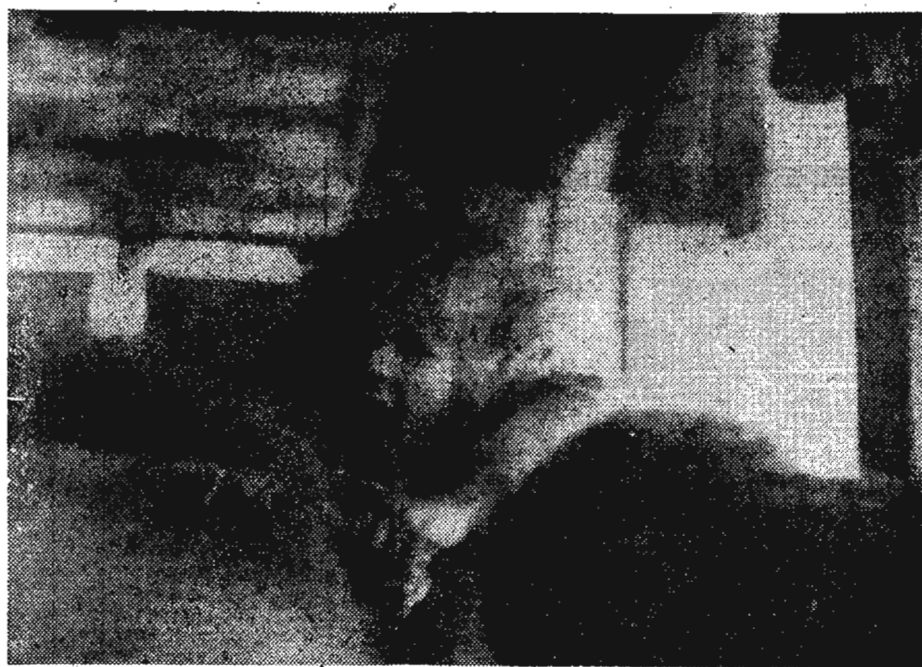
На фотоконкурс «Ленинского шахтера»