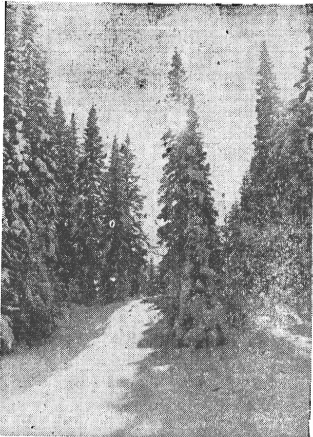
На фотоконкурс „Ленинского шахтера“ ЗИМНЕЕ УТРО.

Вот почему весьма нужным и полезным пособием не только для энергетиков, но и для инженерно-технических работников, занятых на самых различных объектах народного хозяйства нашей области, станет новый справочник «Пожарная опасность электропроводок при аварийных режимах», недавно выпущенный в