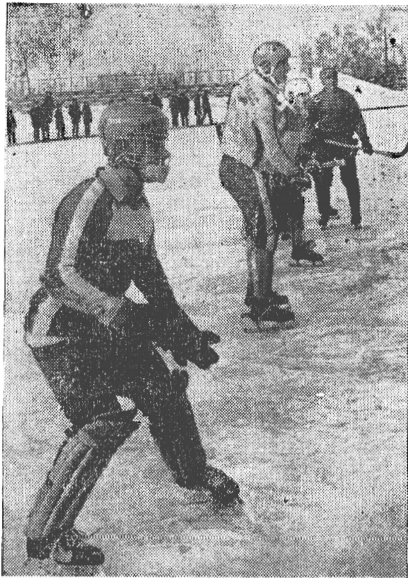
На снимке: розыгрыш штрафного удара. Фото В. АНИКИНА.