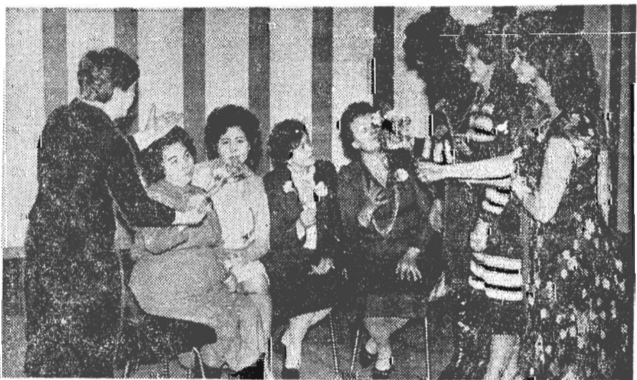
На станции скорой медицинской помощи прошла встреча ветеранов труда с молодежью. За плечами каждого из ветеранов — многолетний труд в медицине.