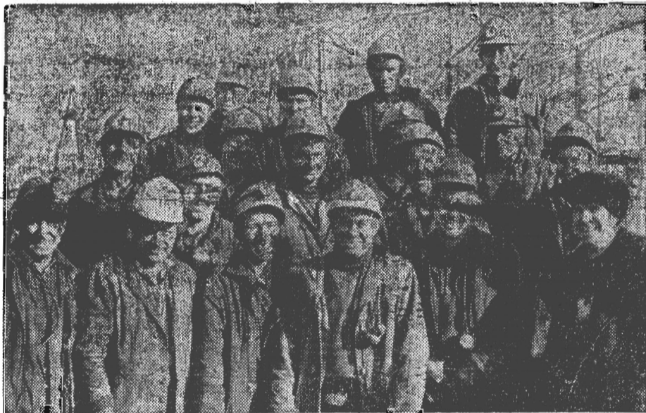
Сегодня на КСК