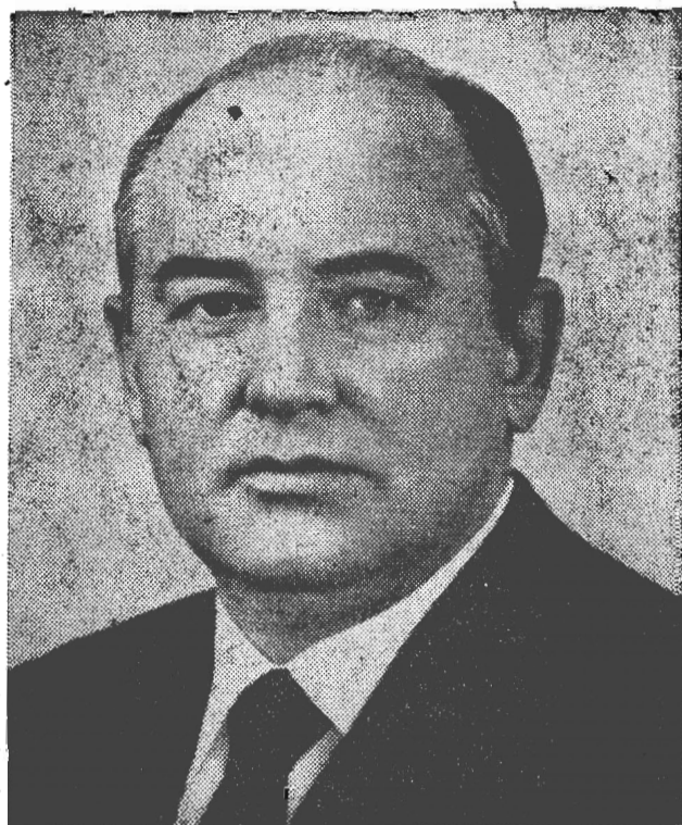
Михаил Сергеевич ГОРБАЧЕВ

Михаил Сергеевич Горбачев родился 2 марта 1931 года в селе Привольном Красногвардейского района Ставропольского края в семье крестьянина.