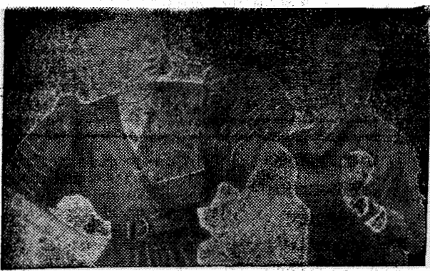
МОСКВА. Из тканей отечественного производства: хлопчатобумажных, шерстяных, льняных, шелковых и других художники-модельеры ВИАЛЕГПРОМА (Всесоюзного института ассортимента изделий легкой промышленности и культуры одежды) создают оригинальные модели одежды.