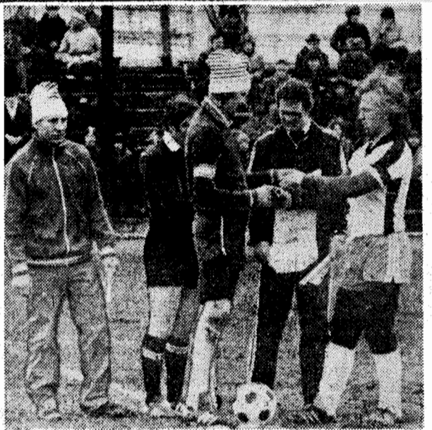
Капитаны команд обмениваются памятными сувенирами; участники матча.

На снимках: опасный момент у ворот «Шахтера»;