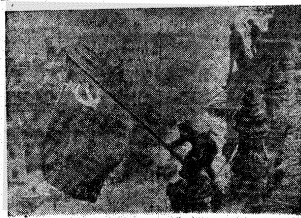
1945 год. Советский флаг над рейхстагом в Берлине.

Т. СТРАХОВА. Председатель городской литературной группы.