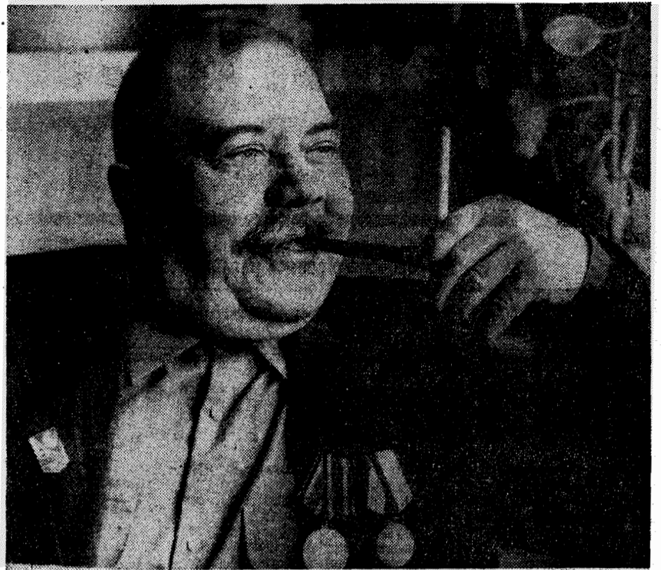
На фотоконкурс „Ленинского шахтера“