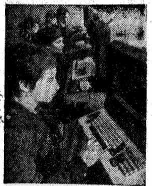
ГРУЗИНСКАЯ ССР. Дисплейный класс контрольно-обучающего курса открыт в Главном вычислительном центре Министерства просвещения Грузии.

Л. КОРЕНЕВ. Экономический обозреватель АПН.