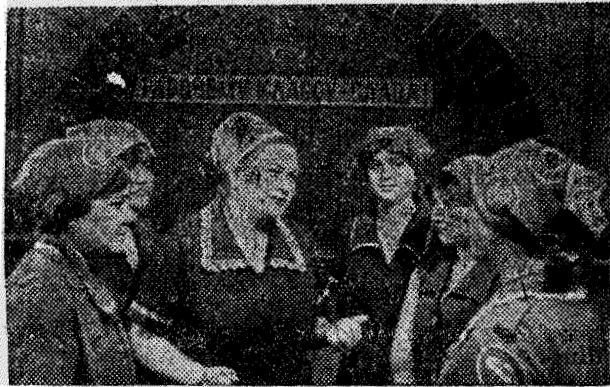
УКРАИНСКАЯ ССР. На 65 миллионов рублей ткачей с индексом «Н» готовится в завершающем году пятилетия Черняговский камвольно-суконный комбинат имени 50-летия Советской Украины. В производство запущено 38 новых видов тканей.

Н. БАЛАСОВА. Научный сотрудник городского краеведческого музея.