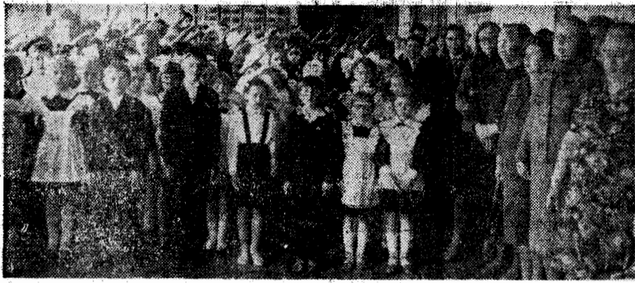
Никто не забыт, ничто не забыто