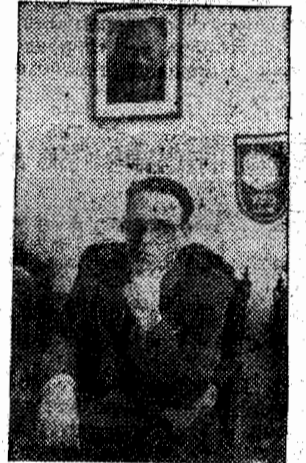
Ленинский районный Совет.