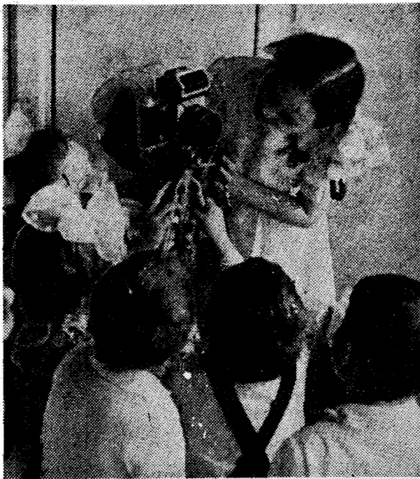
На фотоконкурс «Ленинского шахтера» ЛЮБОЗНАТЕЛЬНЫЕ

Старший инструктор облсовета по туризму и экскурсиям.