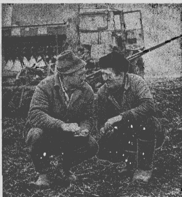
Фотоинформация СЕВ ИДЕТ

23 мая в 15 часов в большом зале ГК КПСС проводится семинар пропагандистов системы экономического образования трудящихся. Приглашаются пропагандисты, председатели и члены экономических советов.