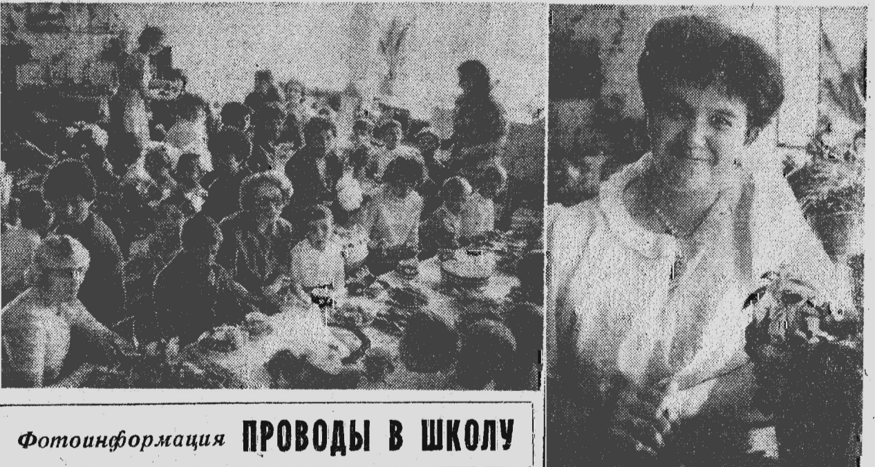
Фотоинформация ПРОВОДЫ В ШКОЛУ

На днях состоялся очередной выпуск ребят в детском саду № 47 Польсаевского завода КПДС. Дети вместе со своими воспитателями подготовили праздничный концерт, в котором прозвучали стихи, песни, исполнялись танцы, выступил детский инструментальный ансамбль.