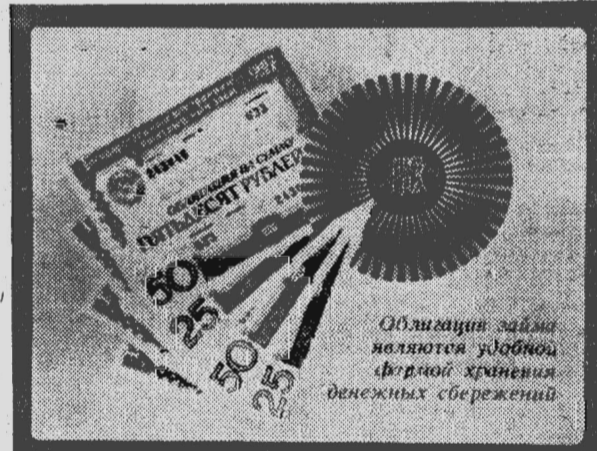
Облигации займа являются удобной формой хранения денежных сбережений

Уважаемые товарищи! 15 августа в г. Краснодаре состоится очередная, 37-й тираж выигрышной по Государственному внутреннему выигрышному займу 1982 года. Облигации займа выпущены достоинством 25, 50 рублей. С 1 июля 1986 года выпущены облигации достоинством в 100 рублей. Выигрыши по займу установлены в размере 10000, 5000, 2500, 1000, 500, 250, 100 рублей на пятидесятирублеую облигацию. В 1987 году тиражи выигрышей по Государственному займу 1982 года состоятся: 15 февраля — в Баку, 30 марта — в Ленинграде, 15 мая — в Минске, 30 июня — в Запорожье, 15 августа — в Кипинове, 30 сентября — в Ростове-на-Дону,