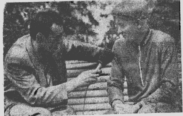
Москва. В загородном филиале Центрального госпиталя МВД СССР находится на восстановительном лечении группа пожарных, первыми вступивших в борьбу с огнем во время аварии на Чернобыльской АЭС. В настоящее время они уже не нуждаются в медикаментозном лечении, проходят курс климатотерапии, диетотерапии и лечебной гимнастики и в ближайшее время смогут приступить к работе.