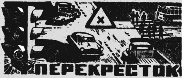
ПЕРЕКРЕСТОК Выпуск № 4 (79)