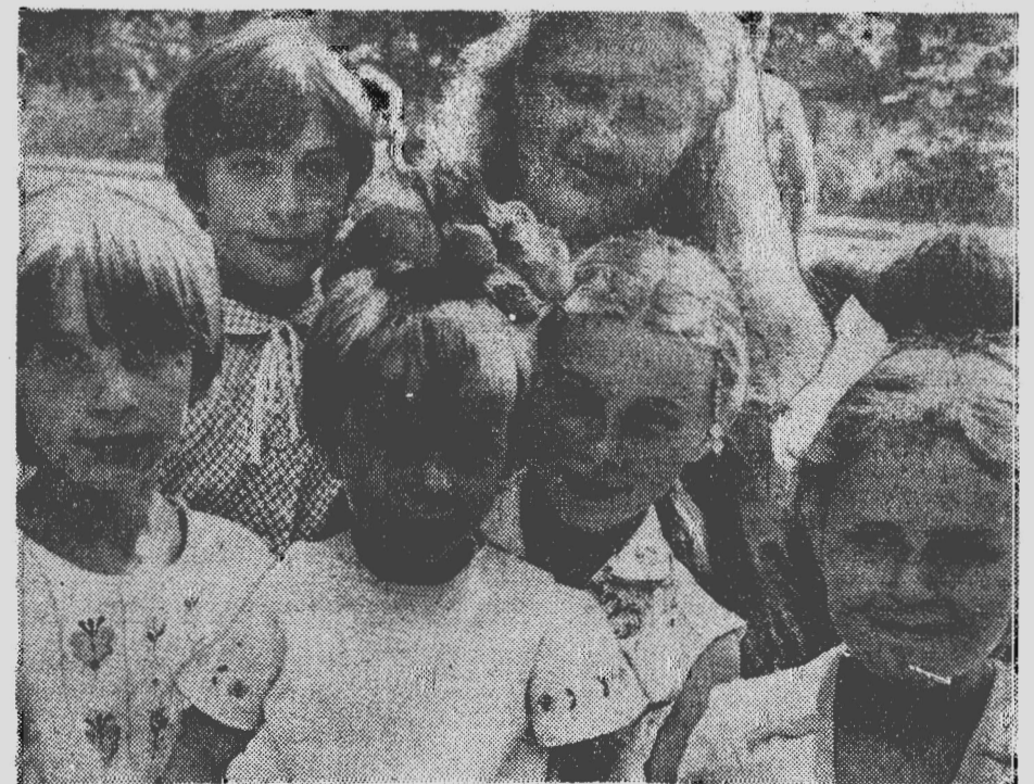
На фотоконкурс «Ленинского шахтера»