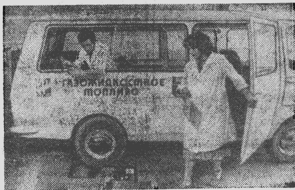
Узбекская ССР. В столице республики проводятся испытания автомобилей «Жигули», «Москвич», «Латвия», работающих по так называемой двухтопливной схеме — на газе и, в случае необходимости, на бензине. Эта новинка разработана в Ташкентском авторемонтном институте (ТАДИ).