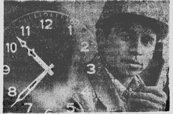
СВЕРДЛОВСК. Автоматизированная система управления производством внедряется на заводе железобетонных изделий Свердловского домостроительного комбината.

Электроника взяла на себя контроль за движением готовой продукции и соблюдением графика поставок, расчет потребностей в деталях, многое другое. Несколько секунд требуется ЭВМ, чтобы выдать справки, составлением которых раньше занимались десятки людей.