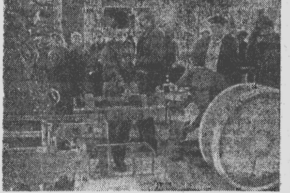
УКРАИНСКАЯ ССР. В Днепетровске открыт специализированный магазин по продаже населению отходов металлургического производства. Здесь можно купить огнеупорный кирпич и рельсы для перекрестий, арматурную проволоку и швеллеры, известковый раствор и различные трубы. Раньше все это, не пройдя контроль ОТК или отслужив нормативный срок, выбрасывалось в отвалы, сжигалось или отправлялось на переработку. Теперь эти товары стали настоящей находкой для домашних умельцев. Тем более, что стоимость их минимальная. В магазине можно получить квалифицированный совет специалиста, нарезать резку, сварить трубу нужной длины. Все заботы по доставке крупногабаритных товаров взял на себя магазин.

На снимке: в торговом зале магазина.