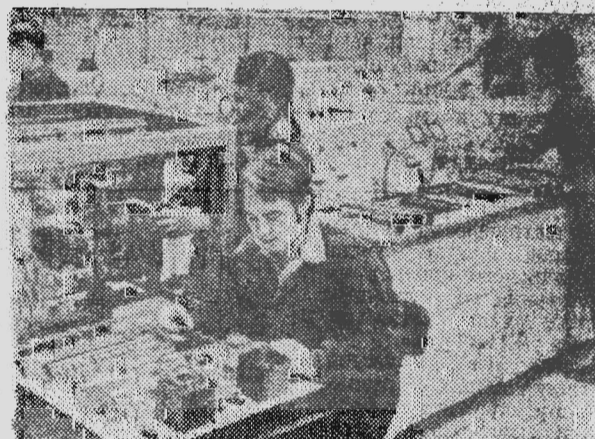
СРР. Бухарестское предприятие «Электротехника» специализируется на выпуске электроприводов для станков с числовым программным управлением. Большая часть продукции завода экспортируется в СССР. На снимке: в цехе «Электротехники».