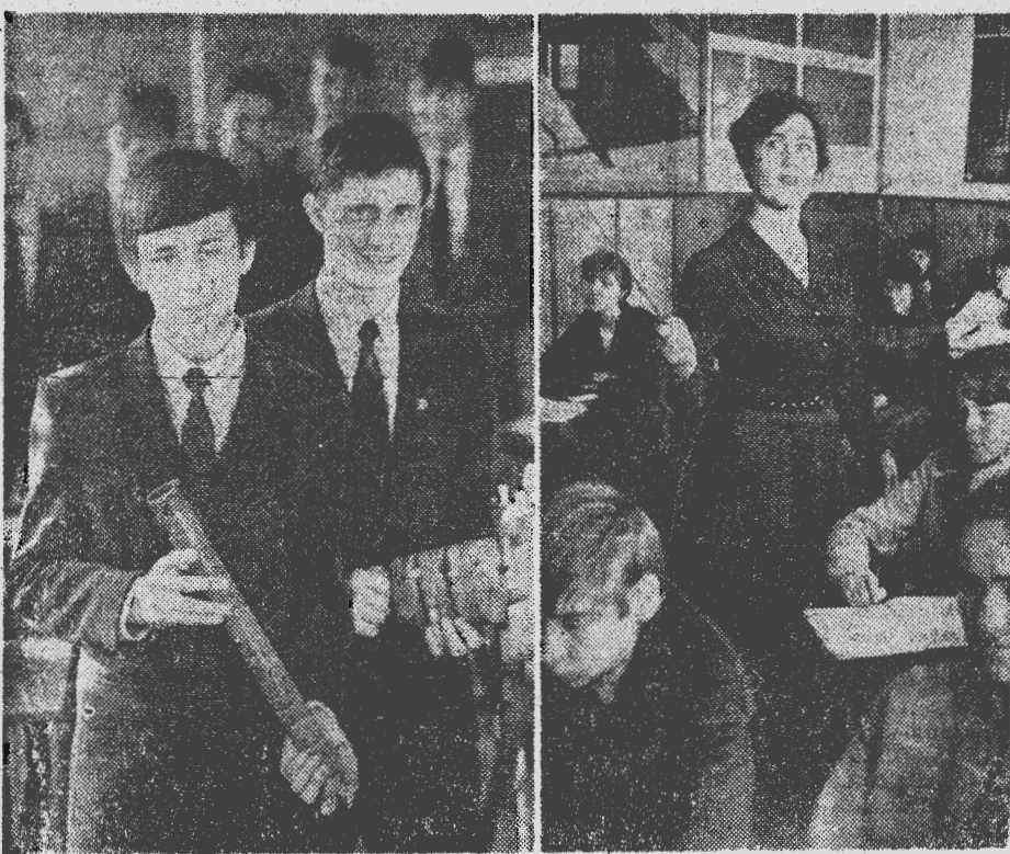
Горный техникум — одно из старейших учебных заведений города. За 44 года своего существования он подготовил и выпустил более 14 тысяч специалистов разного профиля. Сейчас в техникуме на дневном и вечернем отделениях готовят юношей и девушек по пяти специальностям. В этом году здесь обуча-

Записала И. ОГНЕВА. Член комитета ВЛКСМ КСК.