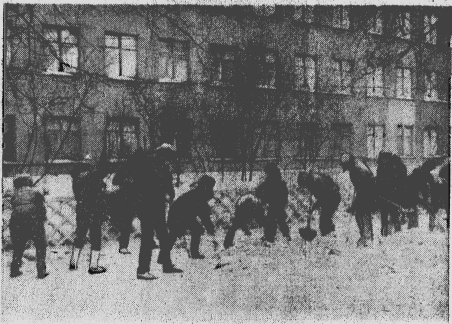
Еженедельно тысячи горожан выносятся мусор. Все делается для того, чтобы город стал краше, чтобы улицы радовали глаз. На снимке: идет уборка снега.