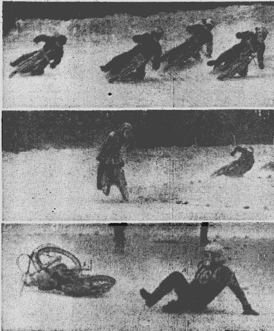
На фотоконкурсе „Ленинского шахтера“