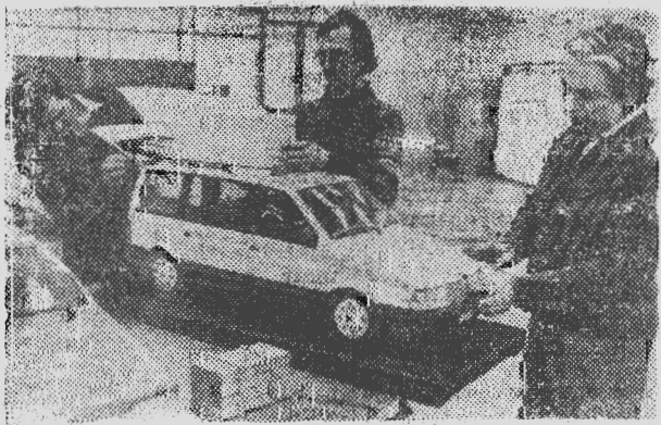
МОСКВА. В социалистических обязательствах коллектива Автомобильного завода имени Ленинского комсомола на 1986 год намечен выпуск первой серии легковых автомашин «Москвич-2141» в количестве 2000 штук.

Сейчас на предприятии полным ходом идет реконструкция, направленная на создание гибкого автоматизированного производства автомобилей. Результатом первого этапа реконструкции станет серийный выпуск нового «Москвича», который послужит базой моделью для других легковых автомашин. Последуют различные специализированные модели «Москвича»: для медицинской помощи, для сельской местности, для такси.