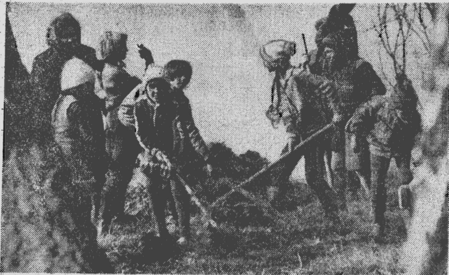
Идет месячник по уборке, санитарной очистке и благоустройству