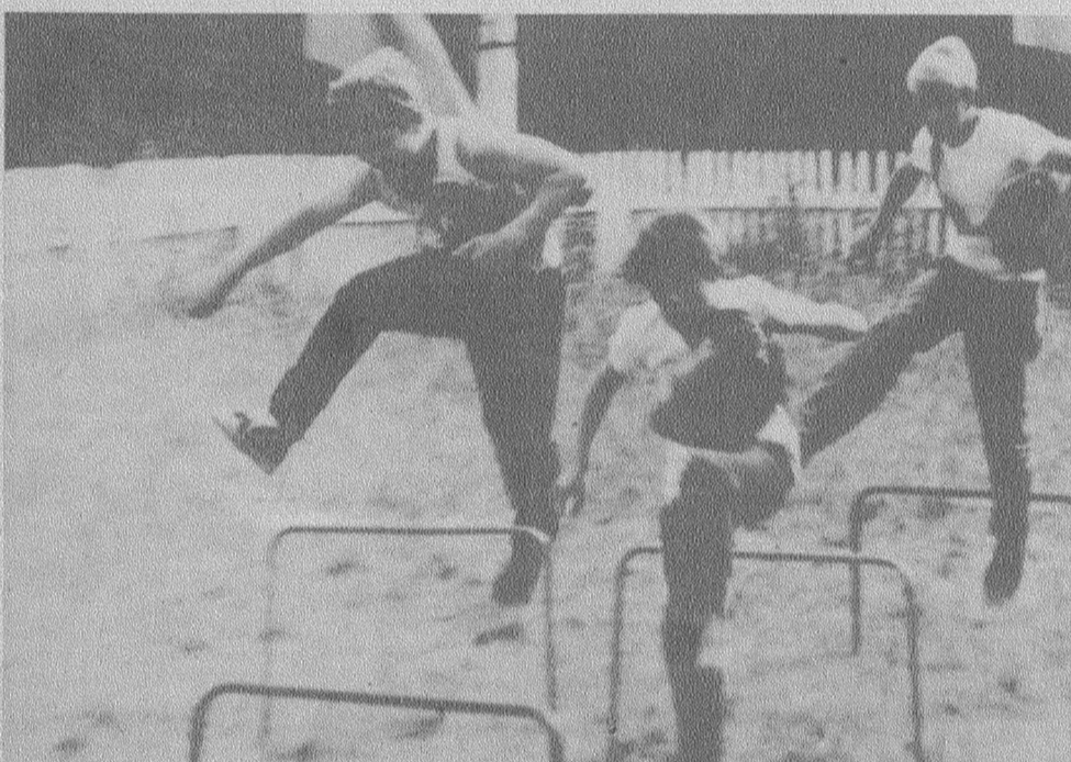
На фотоконкурс «Ленинского шахтера»