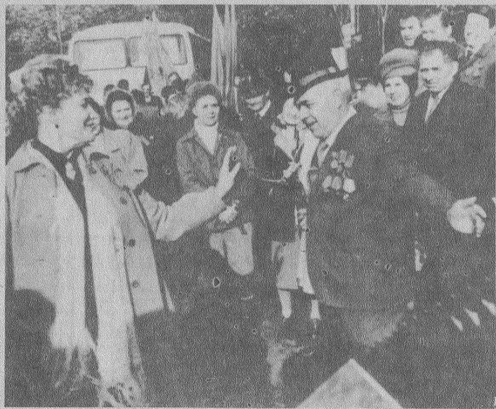
Эх ты удал молодецкая!

Нью-Йорк. Пьянство и алкоголизм превращаются в одну из острых проблем американской молодежи. Такой вывод содержится в результатах исследования, которое было проведено рядом правительственных и частных организаций США, занимающихся проблемами образования и здравоохранения. Обследован 11 тысяч учащихся средних школ, специалисты выяснили, что 28 процентов восьмиклаассников и 38 процентов десятиклаассников злоупотребляют спиртным. (ТАСС).