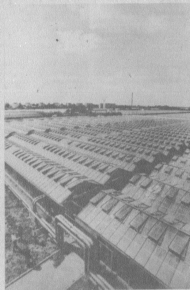
Расширяется сотрудничество польских и советских растениеводов.

На снимке: капитальный ремонт скважины ведет бригада бурильщика Г. Опалько.