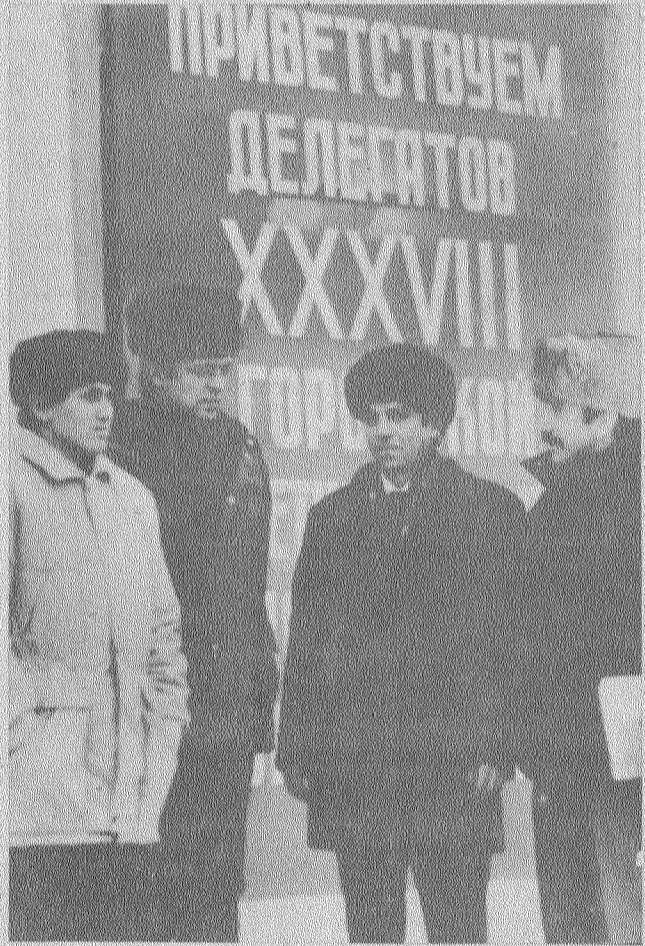
На снимке: делегация шахты имени Кирова.

Не могу не сказать и о некоторых наших проблемах. В 1990 году мы планируем ввести 77 тысяч квадратных метров жилья, но для этого необходимо решить вопрос проектной документации и площадок для строительства. Основной наш заказчик — дирекция по капитальному строительству объединения «Ленинскуголь» — такую документацию не имеет.