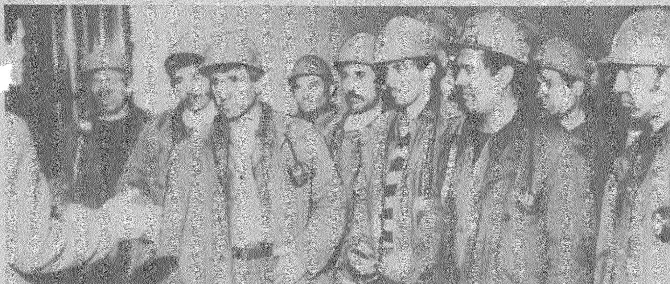
Каждой лаве — высокую нагрузку!