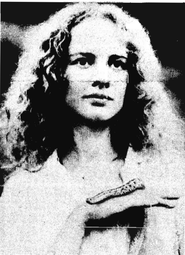
рои фильма любят друг друга и в реальной жизни, и на экране, где с их участием снимается любовная история давно ми-

Думается, на кинокартину английского режиссера Карела Рейша «Женщина французского лейтенанта» можно с уверенностью пригласить поклонников чувствительных мелодрам. Яркое, эмоциональное, сильное кинозрелище о любви, безусловно, придется им по душе. Герои фильма любят друг друга и в реальной жизни, и на экране, где с их участием снимается любовная история давно ми-